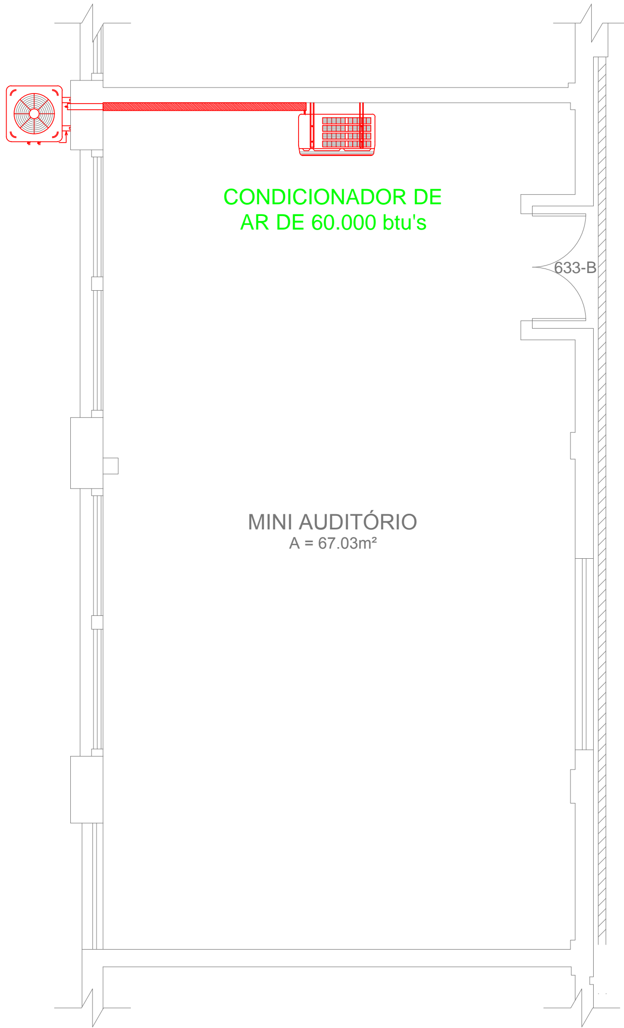
02 PLANTA BAIXA 2º PAV. A CONSTRUIR ESC: 1/50